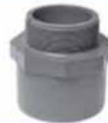
Terminal / So-HE