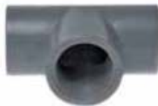
Tee 90° / HI-HI-HI