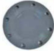
Flange Ciego ANSI B16.5 150 Lb