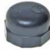
Tapón / HI