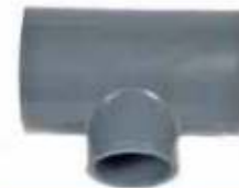
Tee Reducción 90° / So-So-So