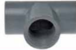
Tee 90° / So-So-HI