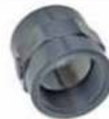
Terminal / So-HI