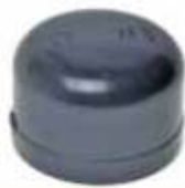
Tapón / So