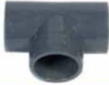
Tee 90° / So-So-So